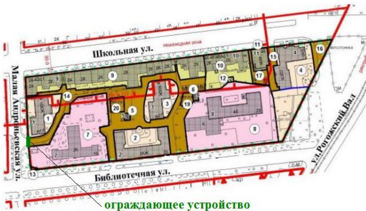
Схема установки ограждающего устройства по адресу: г. Москва, ул. Библиотечная, д. 17

Тип ограждающего устройства: шлагбаум автоматический